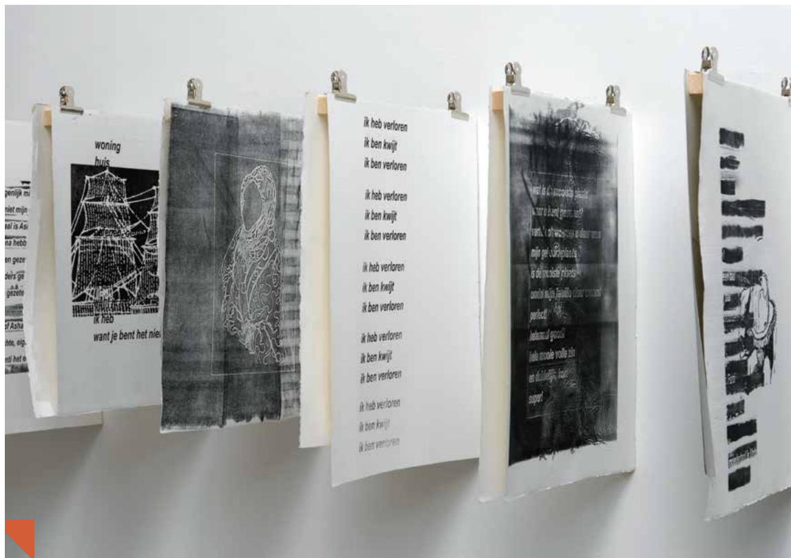
Judith Westerveld, Mother Tongue, in: Faroff Nearby

We bereiken onze vaste doelgroepen door consequent een scala van communicatiemiddelen in te zetten: een actuele website, persbewerking, poster- en flyer verspreiding, digitale nieuws- brieven en natuurlijk een voortdurende stroom van posts op Instagram en Facebook. De komende periode zullen we daar ook andere sociale media aan toevoegen. Een belangrijk onderdeel van de communicatiestrategie is het zwaan-kleef-aan-effect via de samenwerking met wisselende partijen. Zie de openingen: men komt niet alleen voor de kunst maar ook voor het gevarieerde netwerk en verrassende mix van mensen dat Nieuw Dakota biedt. De kunst verbindt lokale en translokale netwerken fysiek met elkaar: Met een nieuw publieksoffensief verbreden we ons publiek stap voor stap. Dat doen we 1) met een fysiek en online publieksprogramma, 2) onderwerpen en activiteiten te agenderen waarmee nieuwe publieksgroepen worden bereikt (Gender Monologues, Nieuw Dakota by Night), 3) in de samenwerking met andere organisaties van elkaars netwerk gebruik te maken (De Balie, Amsterdam Museum, Stichting NDSM-werf / in het verleden: Holland Festival, Nationale Opera, Amsterdam Dance Event), 4) activiteiten in de wijk te organiseren (stichting Malak, Stichting Doras, De Evenaar, De Kleine Wereld.