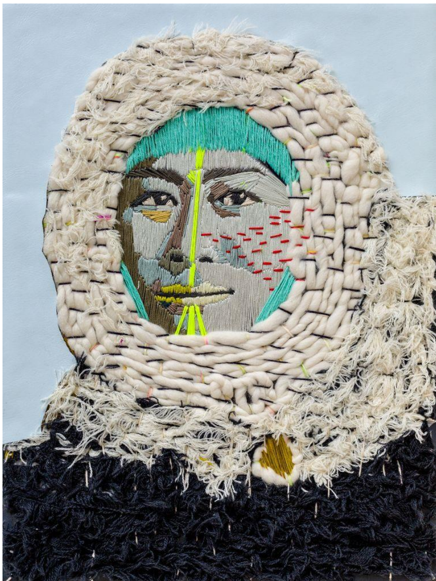
Ma petite inuite # 3 van Preta Wolzak.

Van Bajevic is in Migrating Textile een film te zien over een tapijtfabriek in voormalig Joegoslavië. De vrouwelijke arbeiders slepen met loodzware rollen, de werkruimte is koud en lawaaierig. Op de geluidsband klinkt een weemoedig werkliedje over het vaderland dat niet meer bestaat en de belabberde positie van de ontheemde vrouw.